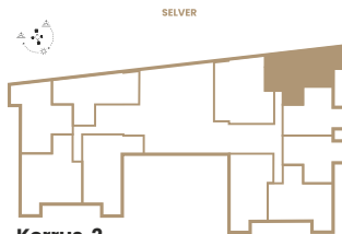
Korrus 2 2th Floor